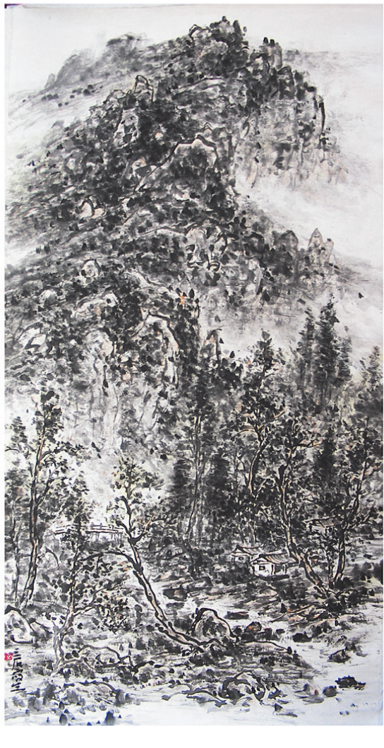
秋韵 枣庄市立新小学 李磊画

经常把我找老师的经历说给别人听,每说一次,自己都会感动一次。生活的磨砺也许使我们不再像儿时那样单纯,但心中那份美好不能忘却。不忘初心,方得始终,让善良多一些表达,让感恩多一些机会。如果你心里想念你的老师,或是父母家人朋友,不要只停留在嘴上与心,要去,要去大胆释放你的爱,因为有些人,有些事,你不去珍惜的时候,也许已经离你远去了……如果能早几年找到我的老师,也许还能看到满校长在世时老师那小鸟依人,幸福的样子。